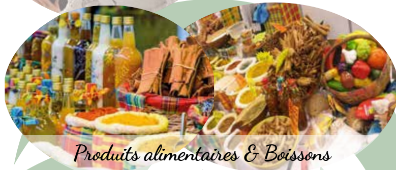
Produits alimentaires & Boissons