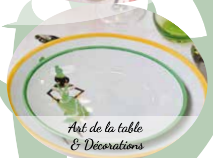
Art de la table & Décorations