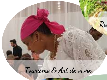
Tourisme & Art de vivre