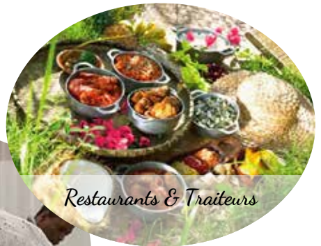
Restaurants & Traiteurs