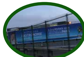
Affichage périphérique, Porte de Versailles et et bus parisien